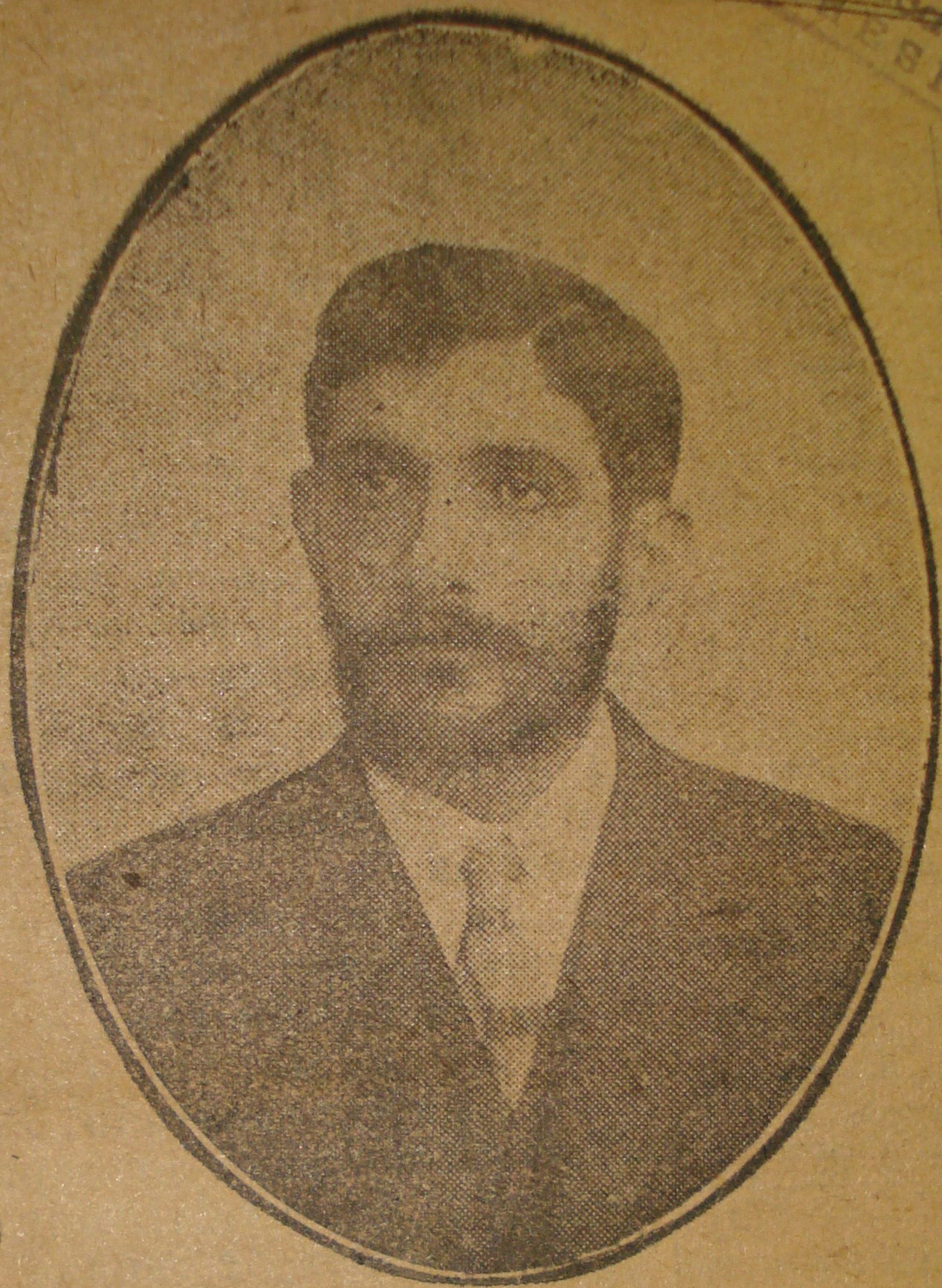
Doutor Antonio Ribeiro Gonçalves Eminente medico piauihyense e influente politico do Estado

vida economica, de ouvir, em nossas verdes mattas, despertando e estimulando as novas energias, o silvo alviçareiro e progressista da locomotiva.